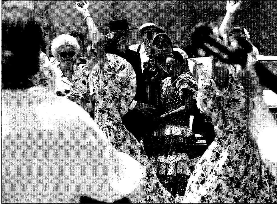
Imagen de la Virgen del Mar, acompañada de los romeros camino de Torregarcía

En las primeras horas de la tarde los romeros se llegaban a la bocana del río, donde tuvo lugar la reagrupación e incorporación de los caballistas y el traslado de la virgen a una carreta de bueyes, para iniciar el camino a pie por toda la costa, fueron recibidos por los vecinos de Costacabana y por los de Retamar que