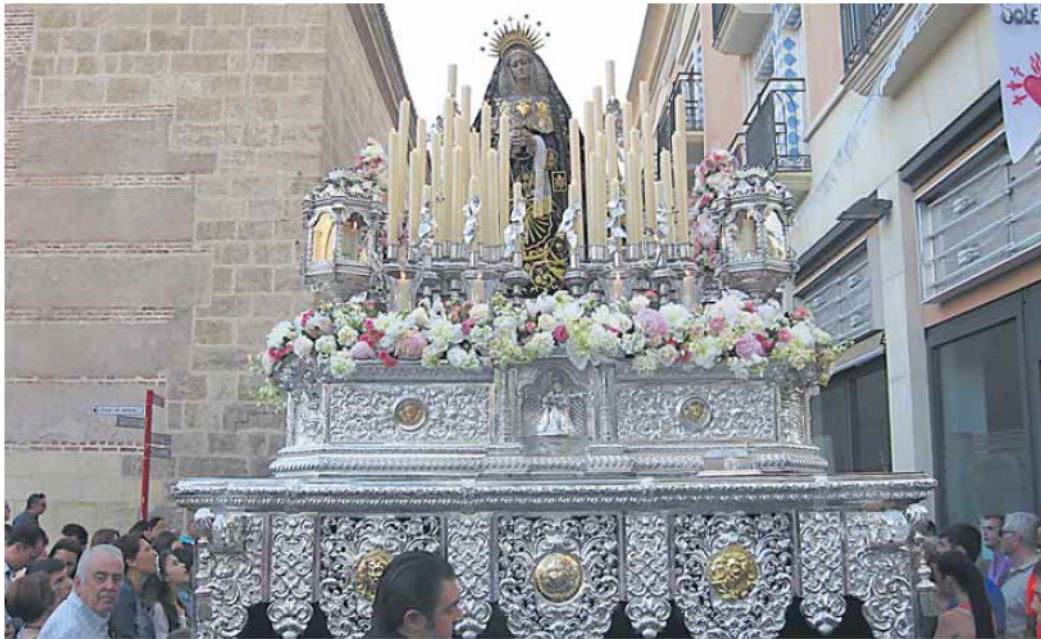
POR LAS CALLES DE ALMERÍA. La Soledad sube desde el templo de Santiago, desde donde salió a las 8'20 de la plácida tarde sabatina, hacia Puerta Purchena. El itinerario varió respecto al del Viernes Santo.