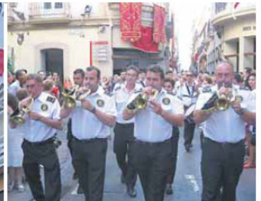
BANDA 'LA OLIVA'. De Salteras (Sevilla), acompañó a la Soledad.