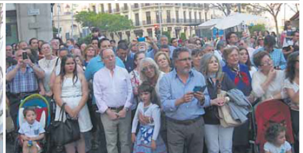
EXPECTACIÓN. Vean cómo se encontraba la Puerta Purchena a las 8'30 de la tarde, esperando el paso de la Soledad. Casi como el Viernes Santo.