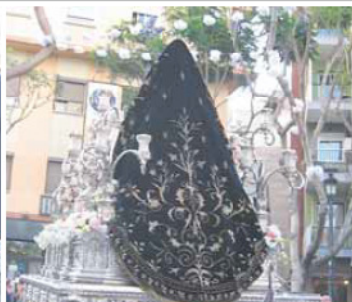
EL MANTO. Negro con bordados de oro. Lo vemos en el discurrir por calle Antº Vico.