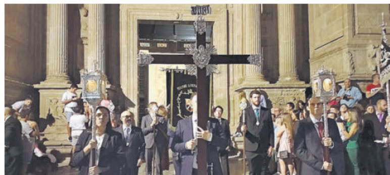
LA CRUZ DE GUÍA, al salir de la Catedral pasadas las 20 horas de la tarde de este especial 12 de octubre.

tradición, hasta que un grupo de hermanos de ambas hermandades encargaron a Vicentillo, un pequeño angelito que lleva un ancla y sujeta, cada Jueves Santo una rosa de la Esperanza.